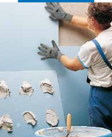
Posa di lastre di polistirolo con Keraflex bianco