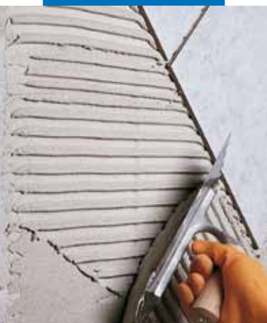
Posa di monocottura su parete in blocchi di cemento cellulare espanso