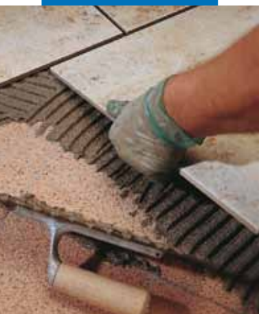
Sovrapposizione di un rivestimento in monocottura su marmette esistenti

– membrane impermeabilizzanti in Mapelastic o Mapegum WPS .