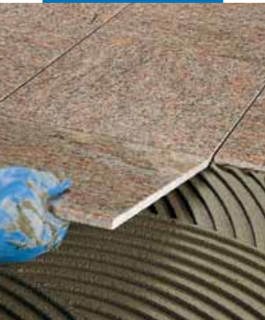
Posa di marmo prelevigato a pavimento