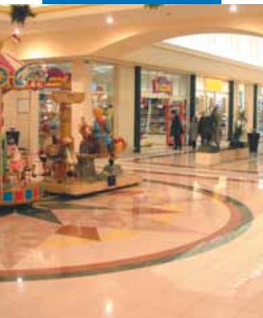
Esempio di posa di grès porcellanato - Centro Commerciale Zanchetta - Treviso